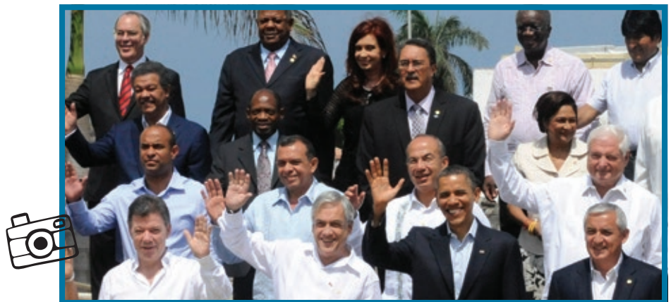
En el año 2012, se celebró la Sexta Cumbre de las Américas en Cartagena de Indias, Colombia.

La CAN fue creada en 1969. Sus principales países miembros son Bolivia, Colombia, Ecuador y Perú; además, participan Chile, la Argentina, Brasil, Paraguay y Uruguay. Busca promover el desarrollo de sus integrantes por medio de la cooperación e integración económica y social.