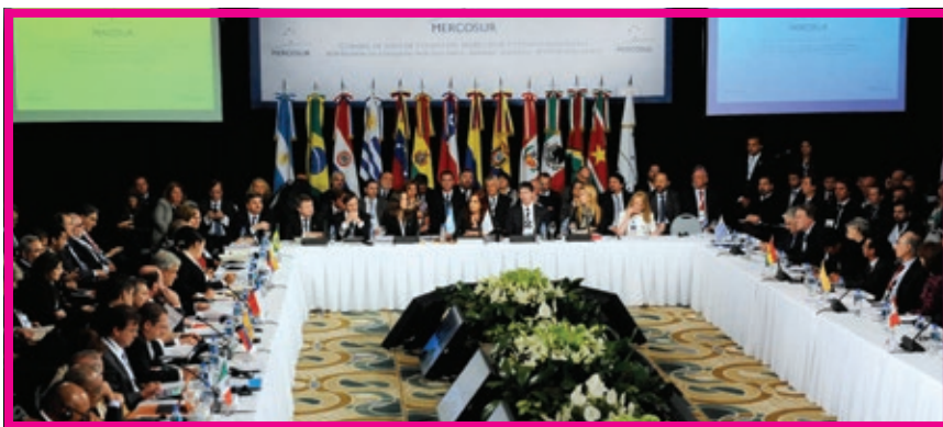
La Cumbre del Mercosur realizada en Mendoza, República Argentina, se llevó a cabo en junio de 2012.