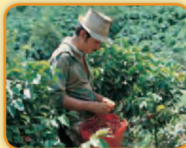
Trabajador rural en un cafetal, en Colombia.