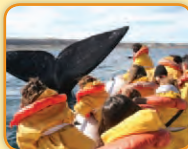
Turistas avistando ballenas en Puerto Pirámide, provincia del Chubut, Argentina.