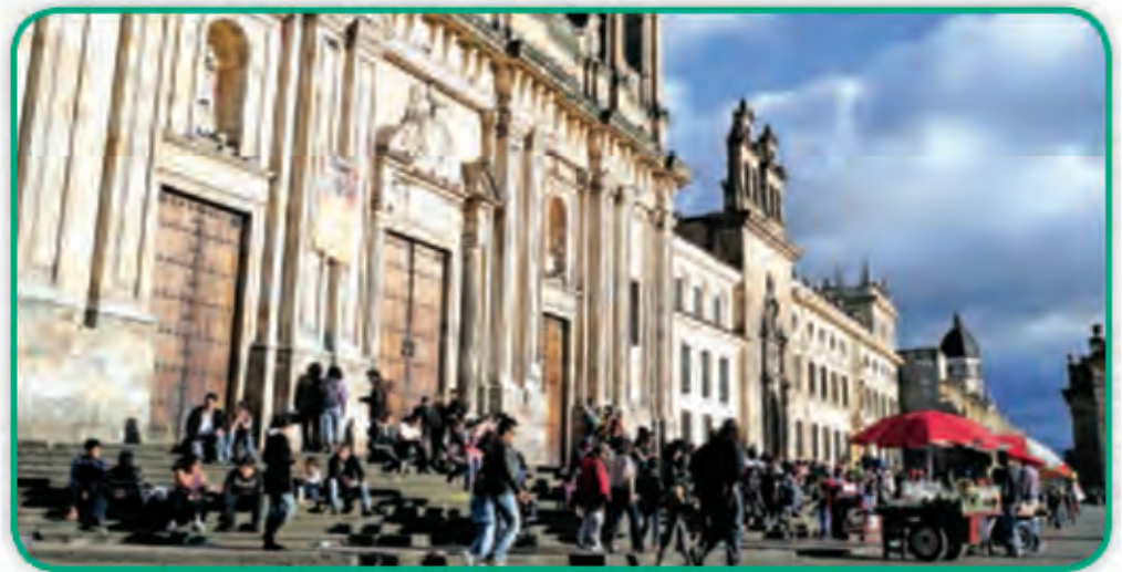
Plaza Simón Bolívar en Bogotá, ciudad capital de Colombia.

Para más información sobre las características de América, vean el video preparado por el Ministerio de Educación Pública de Costa Rica: e-sm.com.ar/caracteristicas_america .