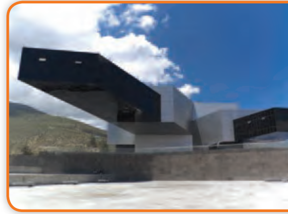
Edificio de la Unasur en la Ciudad Mitad del Mundo: San Antonio, en Pichincha, Ecuador. Fue inaugurado en diciembre de 2014.

Para ello, la Unasur propone una serie de objetivos: erradicar la pobreza y el analfabetismo, construir una ciudadanía sudamericana (es decir que todos los habitantes del bloque tengan los mismos derechos sin importar en cuál de los doce países se encuentren) y coordinar sus actividades económicas, construyendo caminos y vías férreas para una mejor comunicación.