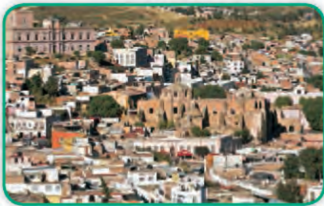
Ciudad de Zacatecas, ubicada en el centro del territorio mexicano.