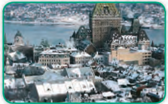
La ciudad de Quebec, en Canadá, posee un centro histórico de estilo francés.