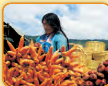
Mercado de verduras al aire libre en el Estado de Chiapas, México.