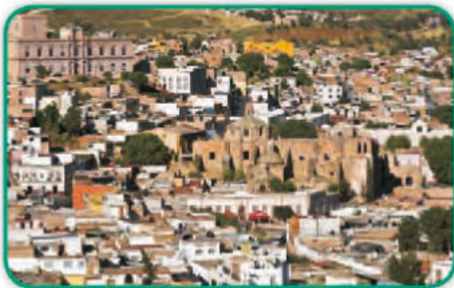
Ciudad de Zacatecas, ubicada en el centro del territorio mexicano.