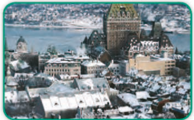
La ciudad de Quebec, en Canadá, posee un centro histórico de estilo francés.