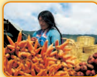
Mercado de verduras al aire libre en el Estado de Chiapas, México.