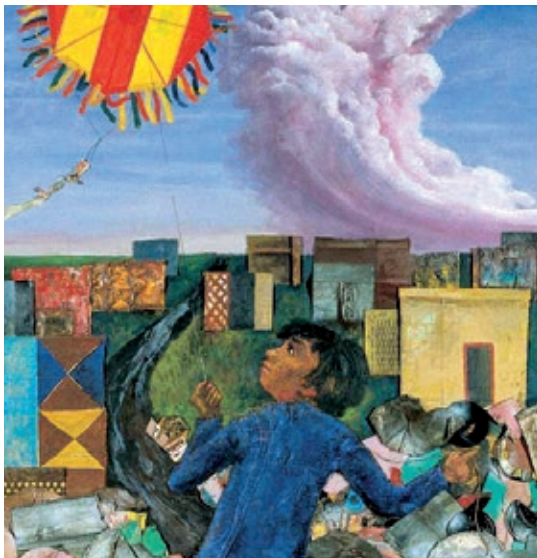
ANTONIO BERNI, JUANITO LAGUNA REMONTANDO UN BARRILETE (DETALLE).